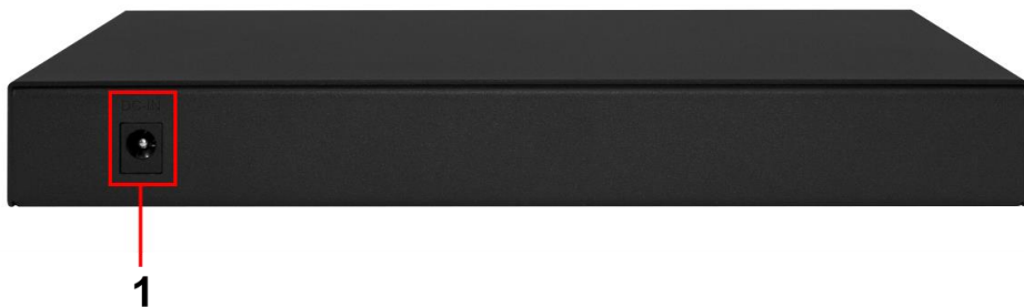
Рис. 3 Коммутатор SW-8D-1(120W), разъемы и клеммы на задней панели