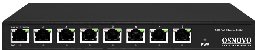
Рис.1 Коммутатор SW-8D-1(120W), внешний вид